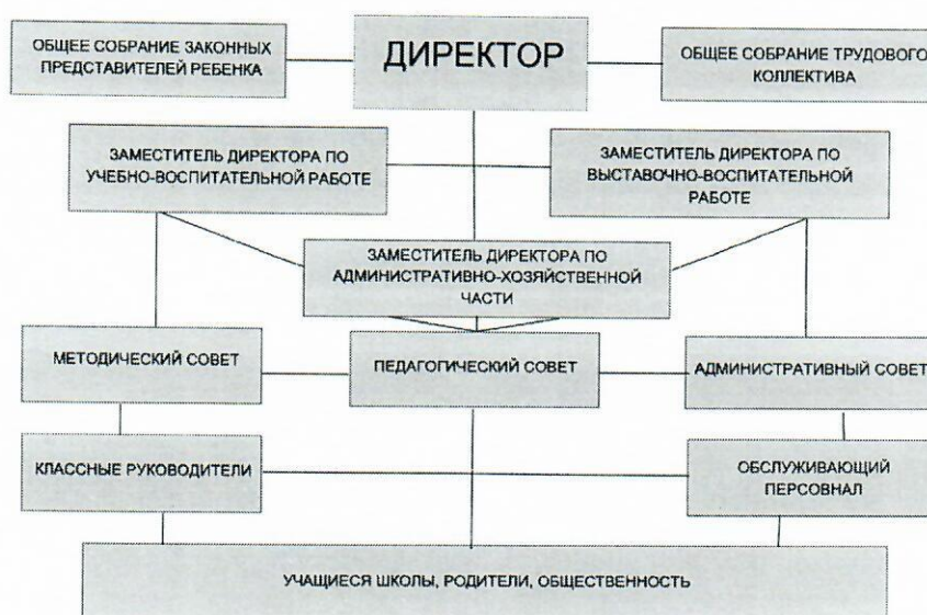
СТРУКТУРА УРАВЛЕНИЯ ОБРАЗОВАТЕЛЬНЫМ УЧРЕЖДЕНИЕМ