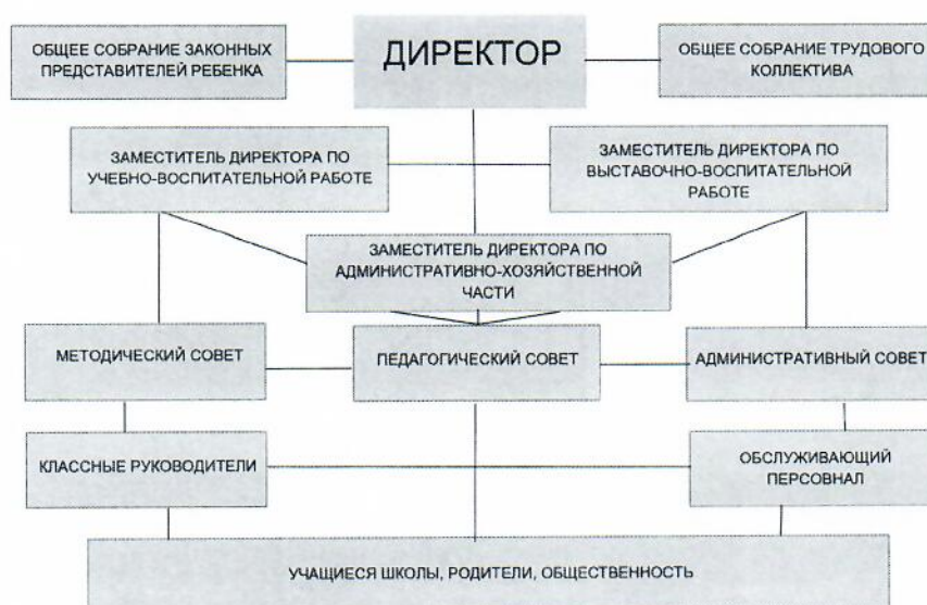
СТРУКТУРА УПРАВЛЕНИЯ ОБРАЗОВАТЕЛЬНЫМ УЧРЕЖДЕНИЕМ

Система управления учреждением для обеспечения выполнения им своих функций ложится на директора образовательного учреждения. Имеющая система взаимодействия успешно обеспечивает жизнедеятельность учреждения в соответствии с реализуемыми образовательными программами.